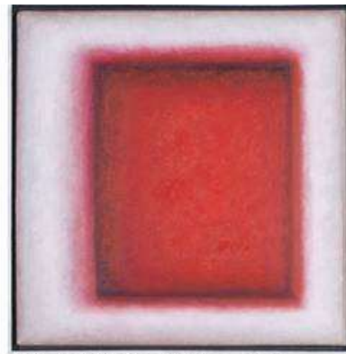
Raffaele Cioffi, Ohne Titel / senza titolo, Öl auf Leinwand /olio su tela, 2019, 40 x 40 cm