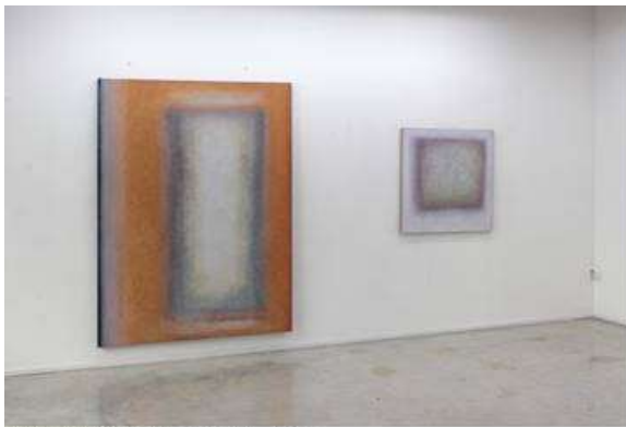
Raffaele Cioffi, Atelier / studio, 2020